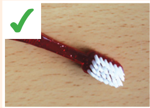
၁စလါဆူအဖိလၢ သ့ထံဒီးတဘၣ်သ့ကသံၣ်ထူးမဲတဂ့ၢ်.