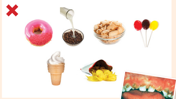
အိၣ်တၢ်အိၣ်တဖၣ်လၢအပၣ်ယုၣ်အိၣ်ဆၢအသဟီၣ်လၢအဆၢန့ၣ်ကမၤဟးဂီၤပမဲသ့ၣ်န့ၣ်လီၤ.