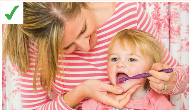
သ့ကသံၣ်ထူးမဲအဘိၣ်လၢအဆံးဒီးကပုၣ်တက့ၢ်.မၤစ့ၤနဖိလၢကထူးအမဲဂီၤဒီးဟါအဂီၢ်တက့ၢ်.မိၢ်ပၢ်တဖၣ်ကဘၣ်မၤစ့ၤအဖိတုၤအသးပျဲထီၣ်ဂ့ၣ်န့ၣ်တစ့န့ၣ်လီၤ.