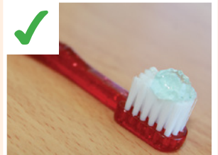
၁စလါတုၤဖိန့ၣ် သ့ဖိသၣ်ကသံၣ်ထူးမဲလၢအပၣ်ယုၣ်ဖလူအိၣ်ရဲး (fluoride) ထဲပထိးချံဖိတဖျၢၣ်အသိး.