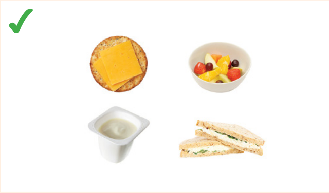
တၢ်အိၣ်ပၣ်ယုၣ်တၢ်သ့ၣ်တၢ်သ့ၣ်ဒီးတၢ်ဒီးတၢ်လၢအသံကစး,ယိကး,တၢ်န့ၣ်ထံသကးဒီးကိၣ်ဘံးစကံးဒီးစဲဝဲတဖၣ်န့ၣ်လီၤ.